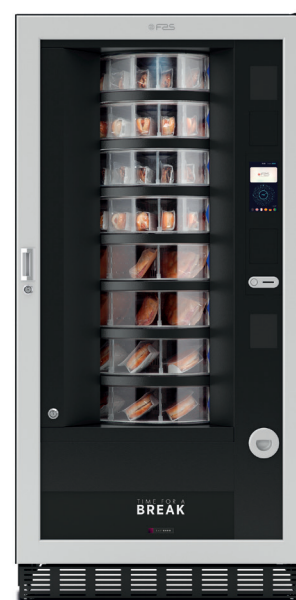
Easy 6000 T