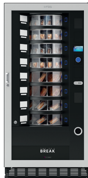
Easy 6000 GCD