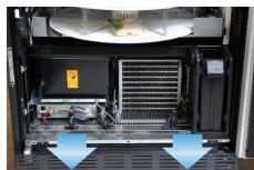
Leicht entnehmbare, kompakte Kühleinheit (angemeldet Patent)