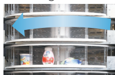
Automatisch öffnende und schließende Klappen mit einstellbarem Timer